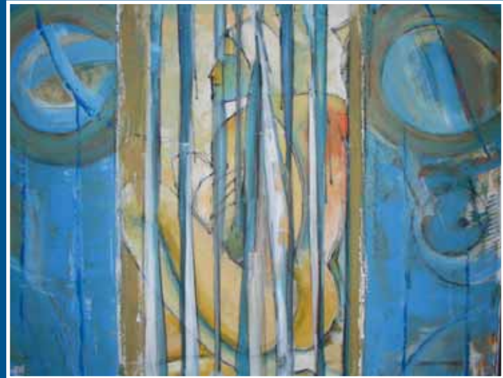
Charles Sambono, «Prisoner of Love», 140 x 110 cm, 2009.