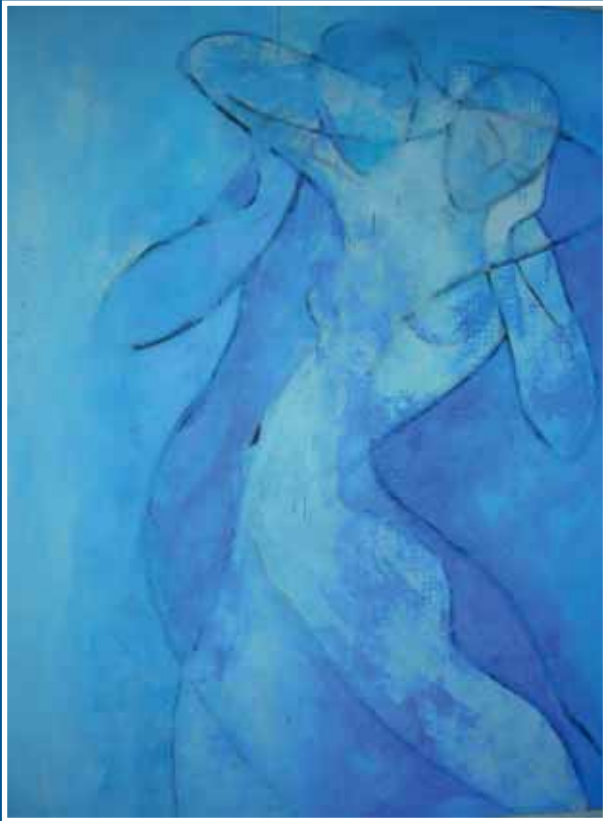
Charles Sambono, «Mixed Emotions», 80 x 100 cm, 2009.