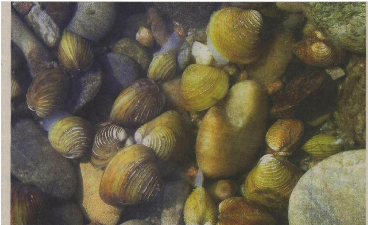
Die Körbchenmuschel erobert die Schweizer Gewässer – im Rhein leben bis zu 10 000 Muscheln pro Quadratmeter.

Eine neue Muschelart breitet sich rasant in der Schweiz aus – und wird zur Bedrohung für die Kühlwasserleitungen von Atomkraftwerken