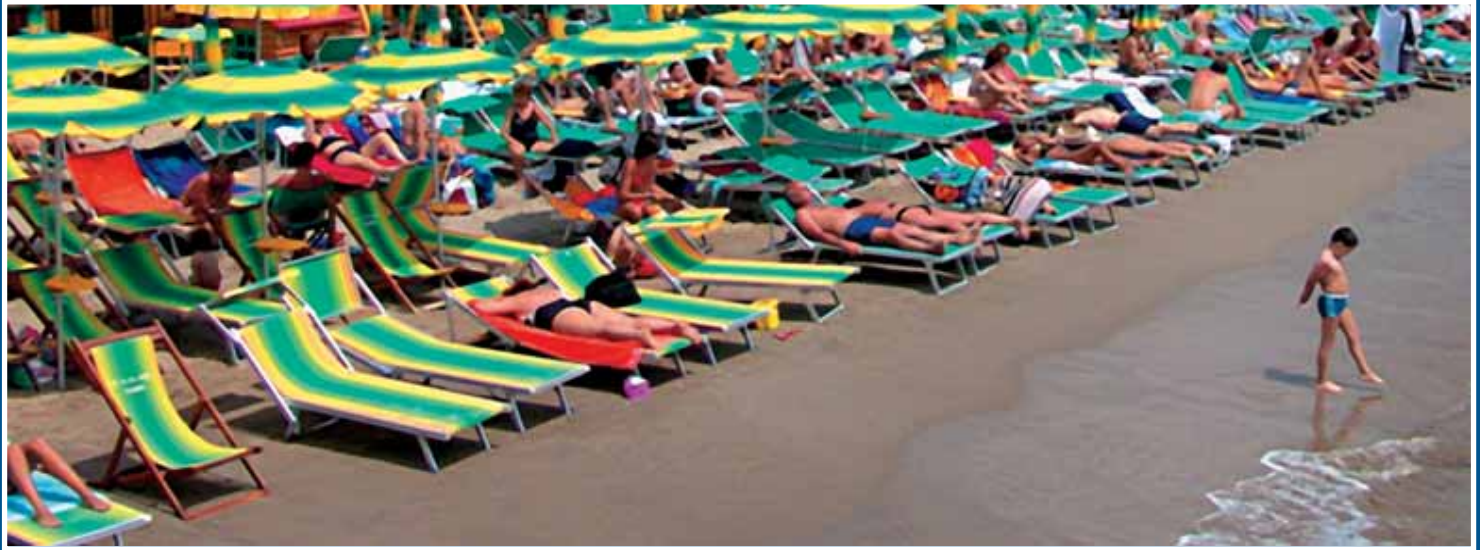
Felix Eidenbenz, «Strandidyll», 140 x 51 cm, 2008.