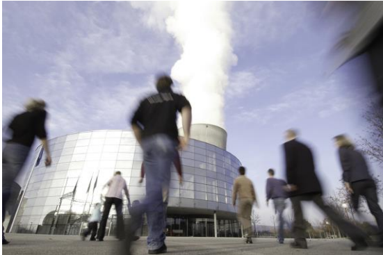
Infozentrum von aussen