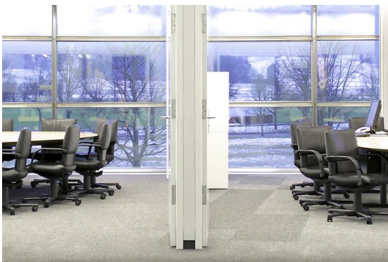
Kleines und grosses Sitzungszimmer