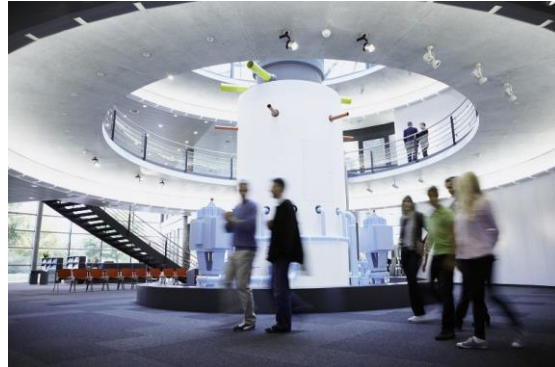
Infozentrum von innen